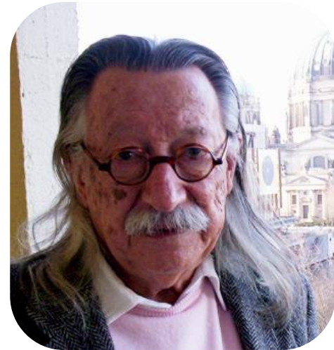
Джозеф Вейценбаум американский учёный, специалист в области искусственного интеллекта.